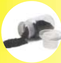
פחם צמחי סופח רעלים וגזים