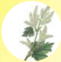
שורש RHEI משלשל עדין