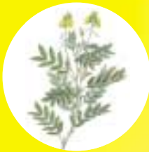
עלי סנה משלשל עדין