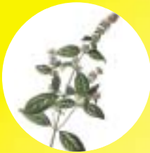
שמנים ארומטיים מנטה ושומר נגד התכווצויות קיבה